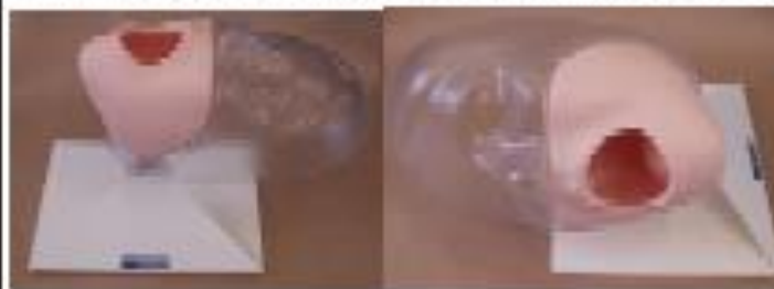
→ノブの締めすぎに注意