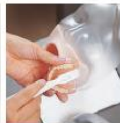
義歯(入れ歯)の手入れ