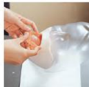
義歯(入れ歯)の観察