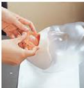
調整 (入れ歯) の時