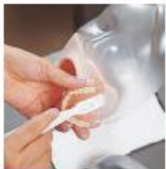
調整 (入れ歯) の手入れ