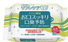
口腔清拭シート リフレケアW