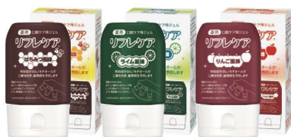
薬用 口腔ケア用ジェル リフレケア