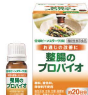
整腸のプロバイオ

お申し込みの際の注意事項がございますので、申込フォームをご参照の上、ご登録ください。