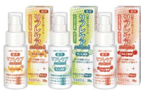
薬用 口腔ケア用ジェル リフレケア